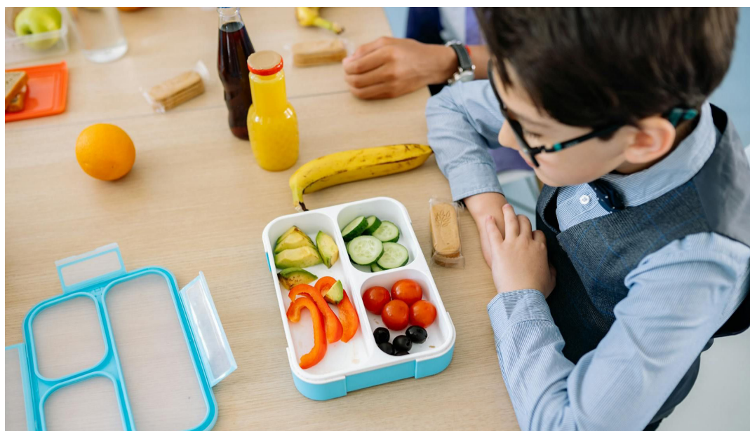
Il cartone animato affronta il tema della celiachia nell'ambito della ristorazione scolastica

In occasione della "Giornata mondiale della celiachia", che si celebra il 16 maggio, la Uoc Sian (Servizio igiene alimenti e nutrizione) dell'Azienda Ulss 9 Scaligera ha realizzato, in collaborazione con la Regione del Veneto e il Gruppo Alcuni, il cartone animato intitolato "Raccontiamo la salute - focus celiachia", al fine di sensibilizzare alunni e insegnanti delle scuole dell'infanzia e primarie su questo tema, nell'ambito della ristorazione scolastica. La celiachia è una patologia autoimmune cronica che colpisce circa l'1% della popolazione generale e che si manifesta, in soggetti geneticamente predisposti, a seguito dell'ingestione di alimenti o bevande che contengono glutine (una proteina contenuta nel grano, nell'orzo, nella segale e in altri cereali). La diagnosi di celiachia risponde a criteri clinici precisi e deve essere effettuata dal medico nei Centri ospedalieri di riferimento regionali.