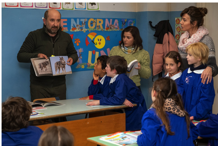
Una scena del film "Un mondo a parte" (Italia, 2024) di Riccardo Milani

più. Ma il destino gli riserva un incontro inaspettato. Alle 19.15 e alle 21.30 si potrà assistere anche a "Un mondo a parte" (Italia, 2024) di Riccardo Milani. Per il maestro elementare Michele Cortese sembra aprirsi una nuova vita. Dopo 40 anni di insegnamento nella giungla romana, riesce a farsi assegnare all'Istituto Cesidio Gentile detto Jurico; si tratta di una scuola composta da un'unica pluriclassa, con bambini dai 7 ai 10 anni, nel cuore del Parco Nazionale d'Abruzzo. Grazie all'aiuto della vicepresidente Agnese e dei bambini, supera la sua inadeguatezza metropolitana e diventa uno di loro. Quando tutto sembra andare per il meglio però, arriva la notizia che la scuola, per mancanza di iscrizioni, a giugno chiuderà. Inizia così una corsa contro il tempo per evitarne la chiusura in qualsiasi modo.