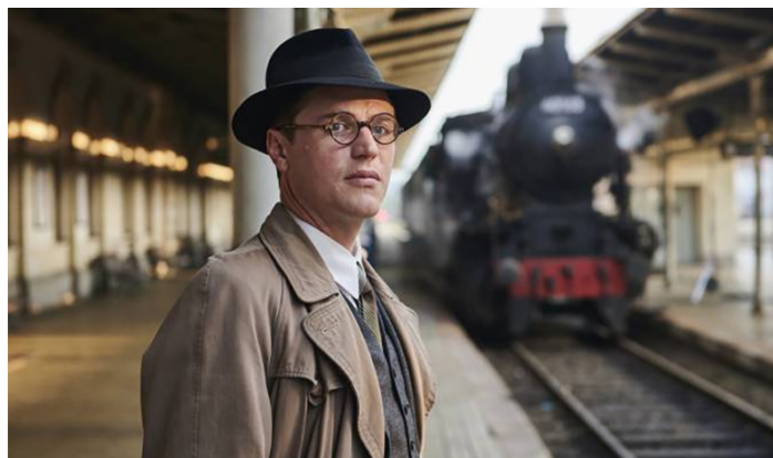
Un fotogramma della pellicola "One life" (Usa, 2023) di James Hawes

trova congiunto in matrimonio a una misteriosa sposa cadavere, mentre la sua vera sposa Victoria attende abbandonata nel mondo dei vivi. Anche se la vita nel regno dei morti si dimostra molto più movimentata della sua rigida educazione, Victor impara che non c'è nulla in questo mondo - o nel prossimo - che lo possa tenere lontano dal suo unico vero amore. In alternativa, alle 21, si può optare per "Challengers" (Usa, 2024) di Luca Guadagnino. Tashi Duncan e un'ex prodigio del tennis diventata allenatrice, una forza della natura che non ammette errori, sia dentro che fuori dal campo. Sposata con un fuoriclasse reduce da una serie di sconfitte, la strategia di Tashi per la redenzione del marito prende una piega sorprendente quando quest'ulti-