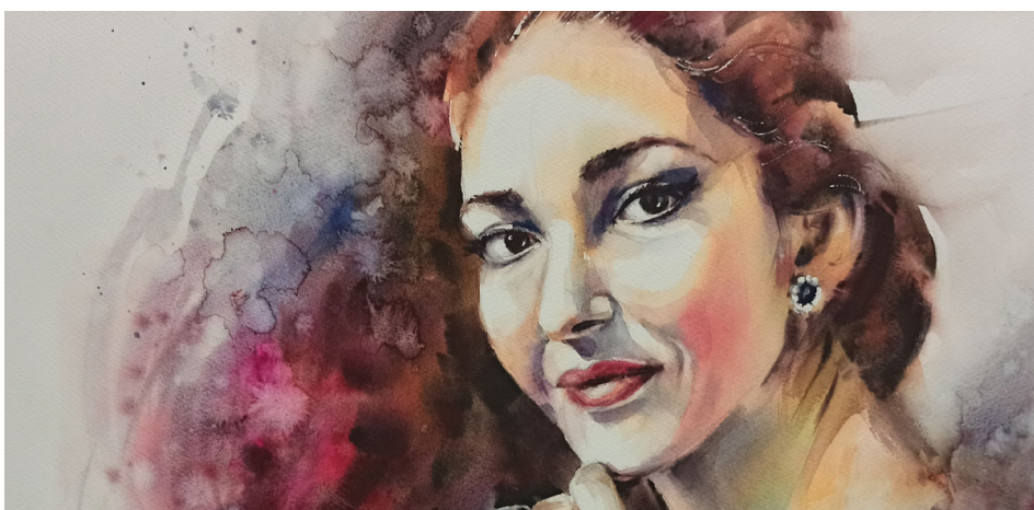
Alcune delle creazioni esposte nell’ambito della mostra “La Divina dell’Opera”