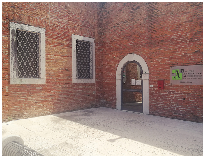
Il Centro Ambientale Archeologico ospiterà l'incontro con Eliana Liotta

Domenica 5 maggio, alle 17.30, "La Cura Sono Io" torna nel legnaghese assieme alla giornalista, scrittrice e divulgatrice scientifica Eliana Liotta, da sempre vicina all'associazione scaligera, trasformata quest'anno in impresa sociale senza scopo di lucro. L'occasione è la presentazione de "La vita non è una corsa" (edito da La nave di Teseo), il nuovo saggio realizzato da Liotta in collaborazione con gli specialisti dell'Università e dell'Ospedale San Raffaele di Milano. A dialogare con l'autrice – che disegna un percorso di soste possibili,