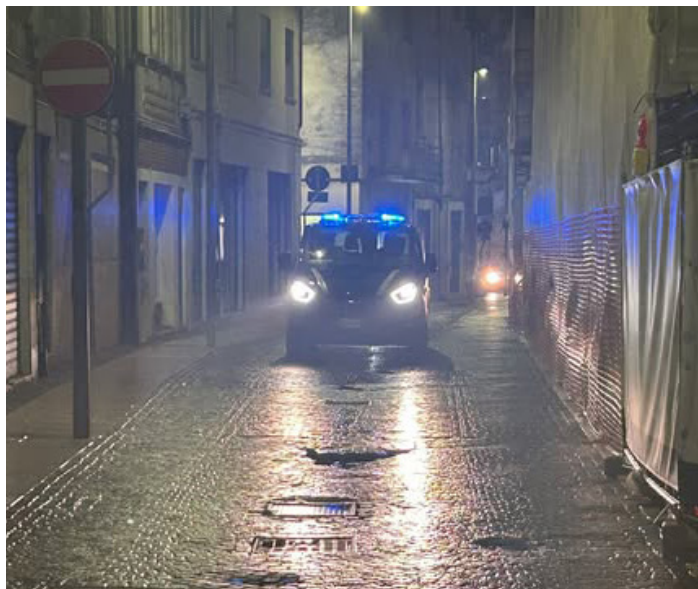
Una pattuglia della Polizia locale attraversa il Centro storico

Proseguono i controlli nel turno serale da parte della Polizia locale di Legnago. In particolare, questo fine settimana tre operatori hanno perlustrato il territorio con particolare attenzione al centro di Legnago, con diversi passaggi anche in via Borgobello, oggetto di diversi esposti di cittadini che lamentano soste irregolari e che non consentirebbero, all’occorrenza, il transito di veicoli di emergenza. La perlustrativa è poi proseguita nel quartiere di Porto, in zona Zai, a San Pietro e a Terranegra. Particolare attenzione è stata posta nella zona adiacente agli esercizi di