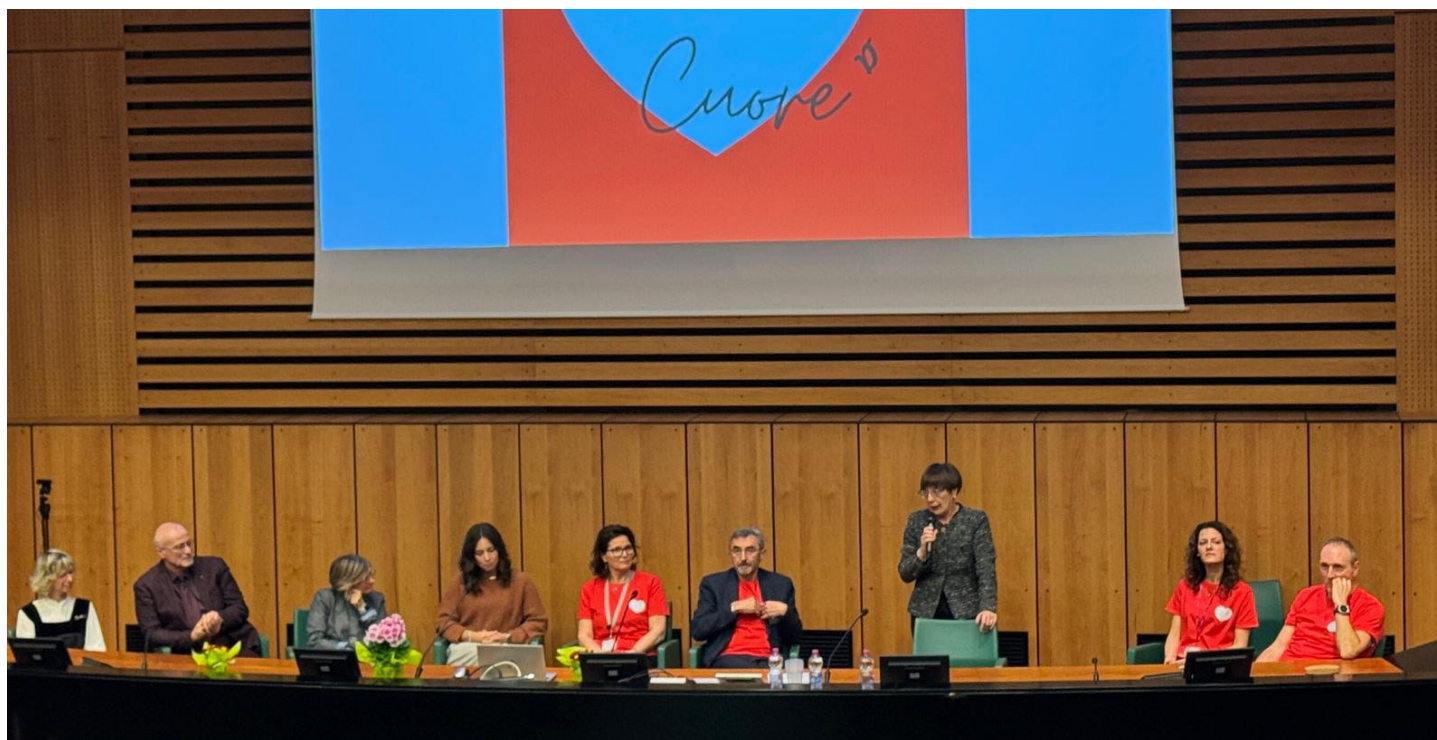
Una foto di gruppo scattata durante l'evento “Cardiologie aperte”, svoltosi nella Sala conferenze dell'ospedale “Fracastoro” di San Bonifacio

Nuova organizzazione in rete degli ospedali di Legnago, San Bonifacio e Villafranca. Il “Mater Salutis” sarà il centro di riferimento per procedure diagnostiche e interventistiche percutanee su coronarie e apparati valvolari