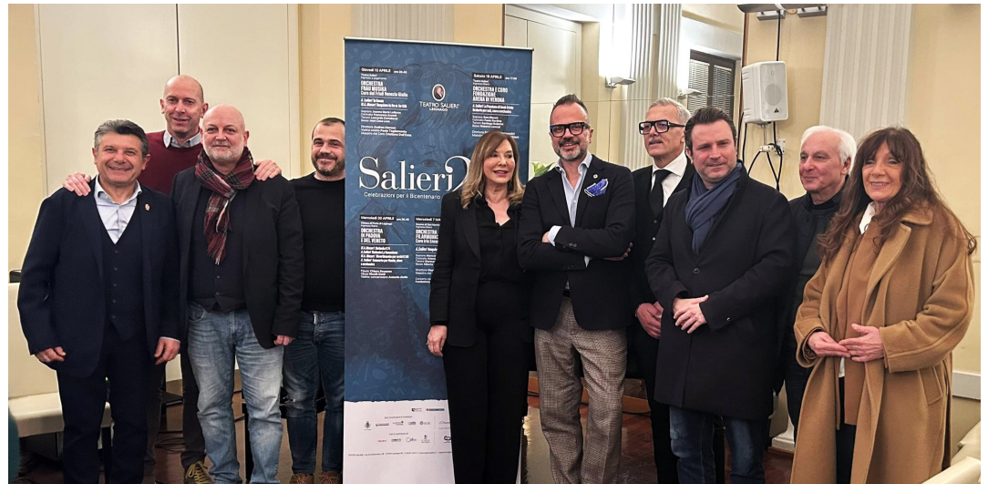
Foto di gruppo per i partecipanti alla conferenza stampa di presentazione del programma di “Salieri200”

Nel Bicentenario dalla morte del suo compositore, il Teatro Salieri di Legnago ne celebra l’immortalità con “Salieri200”, una rassegna di cinque appuntamenti d’eccezione armonicamente inseriti nel percorso artistico tracciato dalla Stagione 2024-2025, dal titolo “Verso il Quinto Elemento”. Un viaggio simbolico alla ricerca del quid, quell’essenza intangibile che rende l’arte eterna. I quattro concerti in programma nei prossimi mesi di aprile e maggio rappresentano il cammino attraverso i quattro elementi (fuoco, acqua, aria, terra) comuni a molte cosmogonie. Ognuno caratterizzato da una dimensione della musica di Antonio Salieri. Si parte da un concerto sacro in cui verranno assieme eseguiti il “Te Deum” di Salieri e il “Requiem” di Mozart, per sfatare il falso mito della rivalità tra i due, giovedì 10 aprile alle 20.45, con l’orchestra Frau Musika e il Coro del Friuli-Venezia Giulia. Si prosegue con l’oratorio “Passione di Gesù Cristo”,